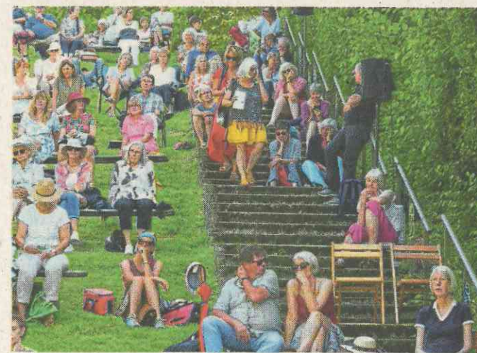
Auf der Flucht vor der prallen Sonne erleben die Gäste die Lesungen dicht gedrängt im Schatten entlang der steilen Treppe.